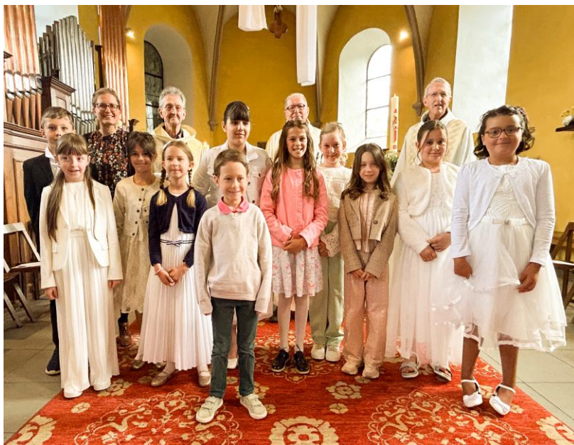
Le groupe des enfants de la première communion 2026