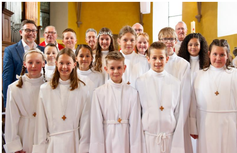
Le groupe des enfants de la confirmation 2026