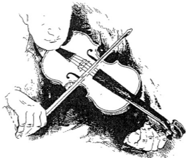
S'accorder sur Dieu

Quelques mots clés pour le temps de Carême