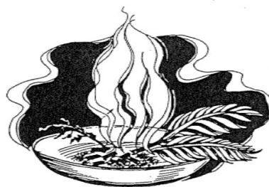
Se savoir tout par grâce