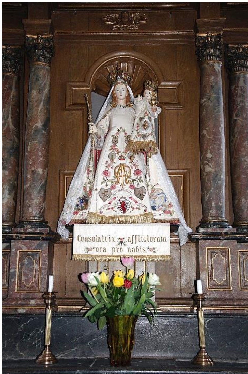
ND de Luxembourg, église de Tintange.

Vendredi 3 mai. Messe à 11h à la cathédrale ; dîner libre en ville ; office de l'après-midi (horaires à confirmer).