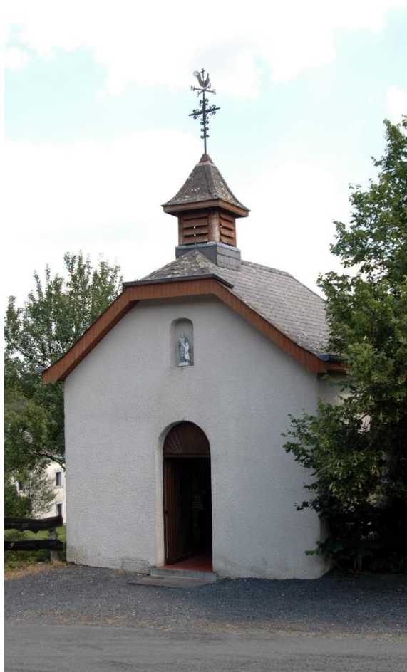
Chapelle de Livarchamps

« C'est le mois de Marie, c'est le moi le plus beau... », si l'adage qui dit que le village de Livarchamps bénéficie d'un microclimat, c'est donc sous un soleil printanier que nous retrouverons le premier dimanche de mai, le 5, à 11h devant la chapelle de Livarchamps pour l'annuel mini-pèlerinage à Notre Dame. Nous poursuivrons cet heureux rendez-vous annuel, après la messe autour du verre de l'amitié offert par la paroisse.