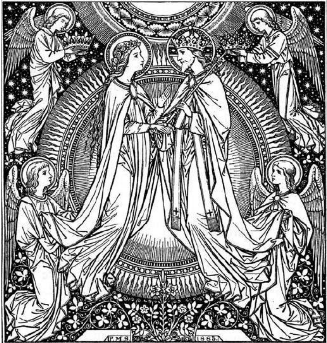
Marie rejoint le Seigneur Jésus dans la gloire du ciel. Illustration d'un missel du 19 ème siècle