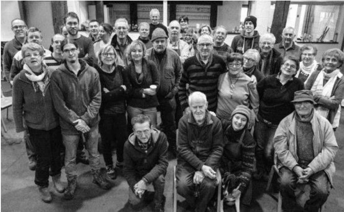
Une partie des nombreux bénévoles lors de la journée de rangements du lundi