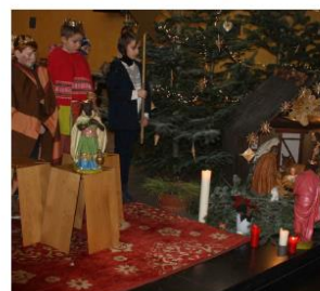
LA FÊTE DE L'ÉPIPHANIE avec les enfants du secteur - janvier 2017

Informations des paroisses catholiques de Haute-Sûre