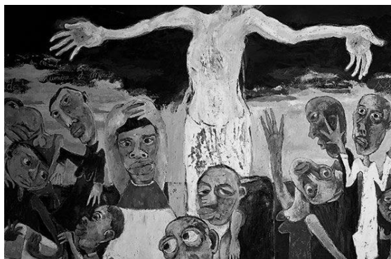
"Élévation", de Marine Allard

A la rencontre de quelques artistes qui, aujourd'hui, traduisent à travers leurs œuvres l'invisible et le mystère pascal, en nous conviant à une indicible joie.