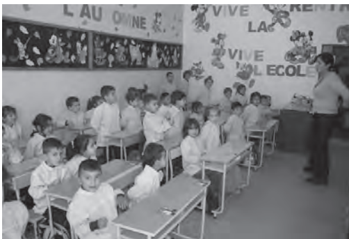
L'école de Jabboulé (Liban)

Notre but est d'aider les religieuses de Notre Dame du Bon Service de Jabboulé et de leur permettre de maintenir leur présence fraternelle et priante dans la région tout en poursuivant leur activité d'accueil et de scolarisation auprès des enfants des milieux les plus défavorisés qu'ils soient chrétiens ou musulmans .